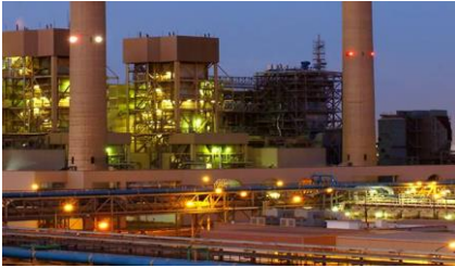
Kerja Sama Industri Luar Negeri