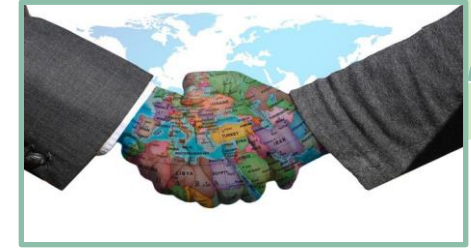
Kerja Sama PT Luar Negeri