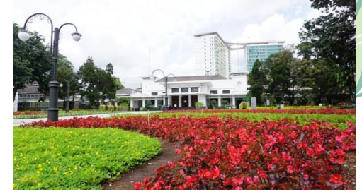
Kerja Sama Pemerintah kota/daerah