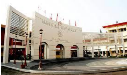
Kerja Sama PT Dalam Negeri