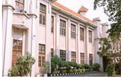
Kerja Sama SMA/K KCD Wilayah VII