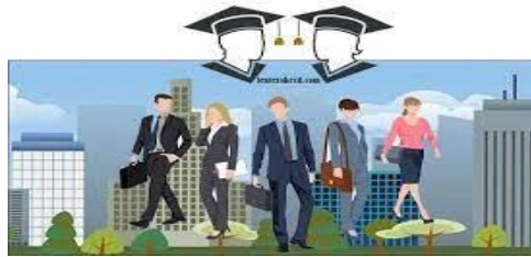
Kerja Sama dengan Industri DN